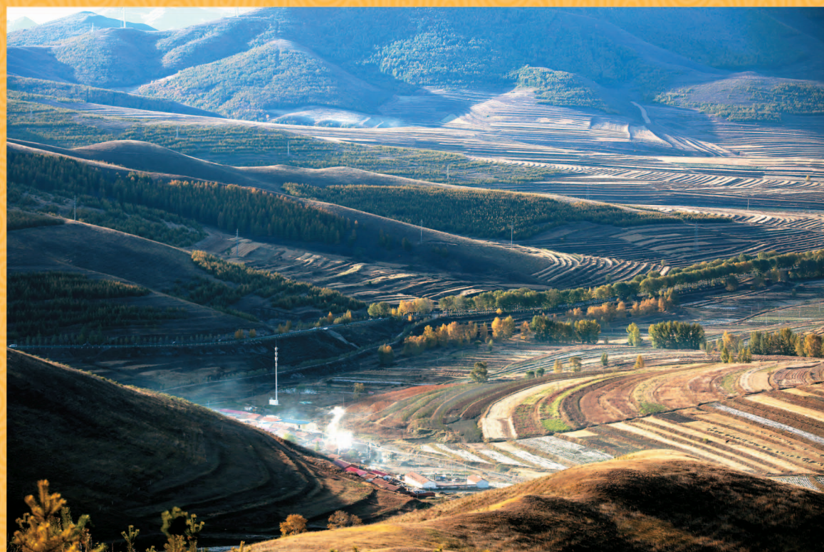
张家口民建会员 齐琦 摄影作品《天路晨曲》