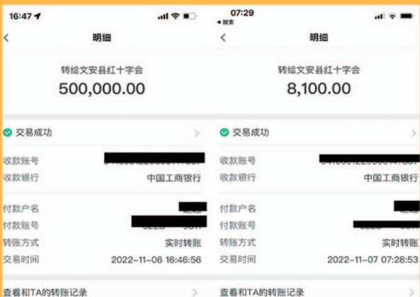
▲11月6日，面对廊坊市疫情出现反复，尤其是文安县疫情防控的复杂严峻形势，民建廊坊市委迅速响应，领导班子和企业家协会会员率先带头捐款，机关干部和文安支部会员纷纷响应，共捐助50.81万元，以实际行动在抗疫大考中诠释了“风雨同舟”的使命担当。