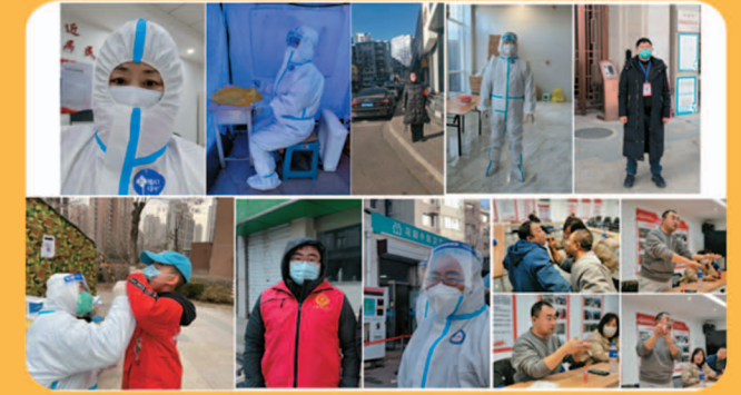
▲11月25日，由于近期多地疫情严峻，防疫工作复杂而艰巨，接到中共承德市委组织部通知各单位居家办公“双报到”志愿服务号召后，承德多名民建会员冒着凛冽的严寒再次下沉社区，包联相关点位防疫工作。